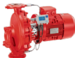
Etaline с PumpMeter и двигателем IE3