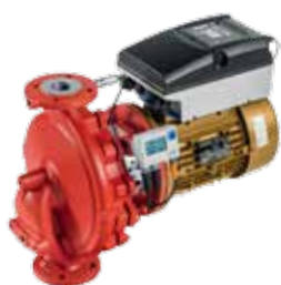
Etaline с двигателем SuPremE®, PumpMeter и PumpDrive Eco