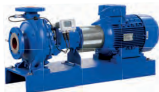
Etanorm с PumpMeter и двигателем IE3